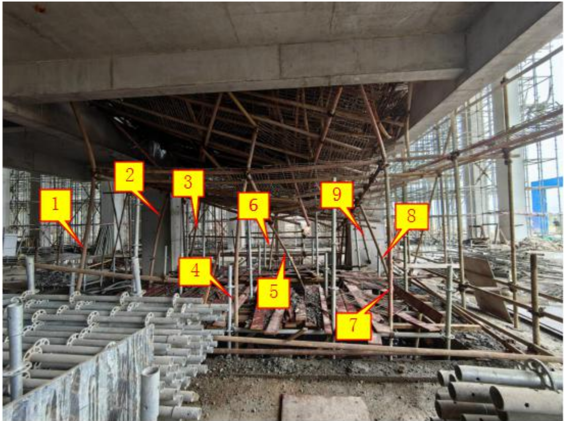
图四 事发电梯井脚手架实际搭设 9 根立杆