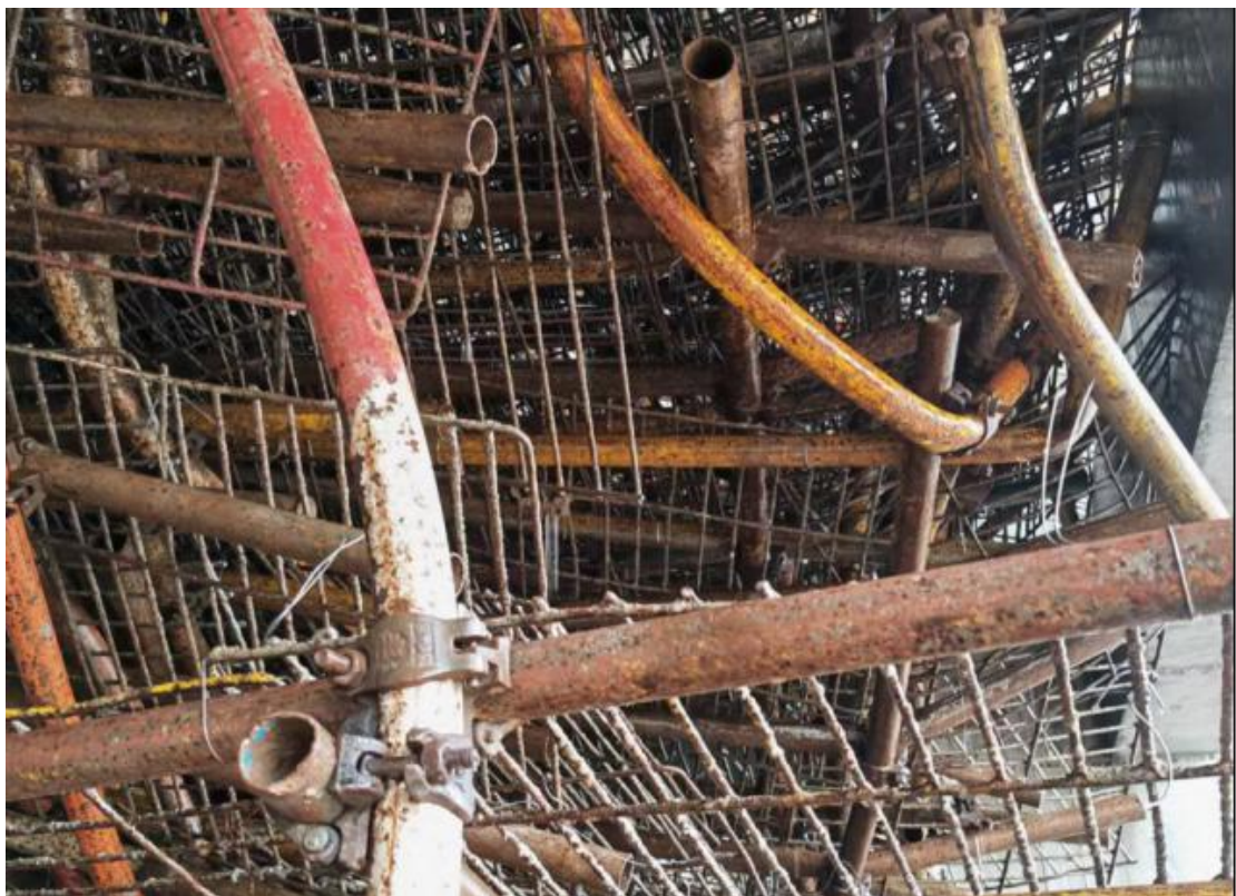
图五 失稳变形的立杆