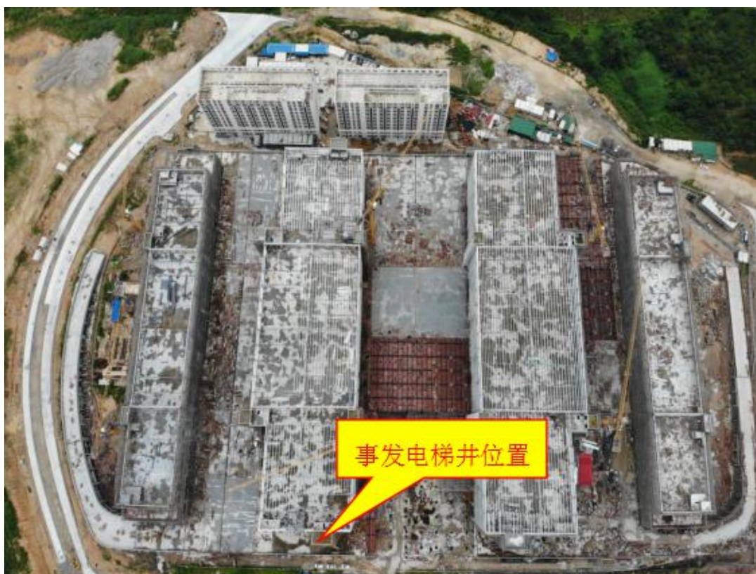
图一 事发坍塌电梯井脚手架位置（俯视）

事发现场位于广州市从化区太平镇低丘缓坡太平工业园南片区的韵达华南电商（广州）产业园基地项目。坍塌脚手架位置是韵达华南电商（广州）产业园基地电梯井道 AG-AH 轴 26*27 轴（又称 C 区 C1 北侧电梯井）。现场可见大量脚手架材料，坍塌后杂乱地堆在离地约 2 米高处，多根立杆扭曲变形，下部呈漏斗状。现场可见散落的 3 顶安全帽，未见安全带。