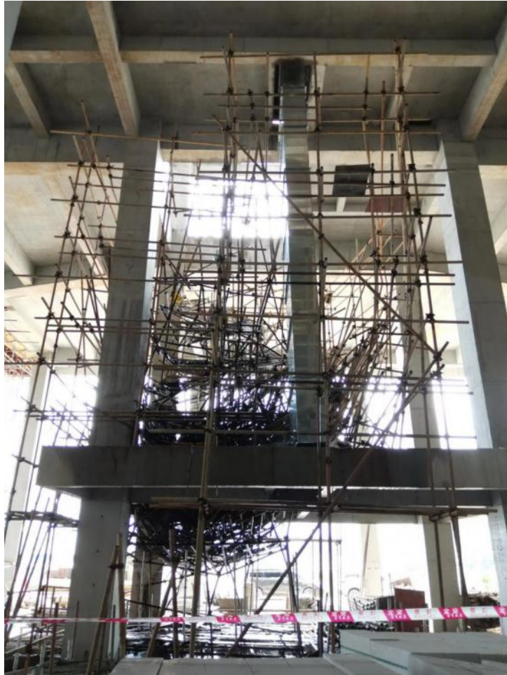
图六 坍塌后下部呈漏斗状的脚手架