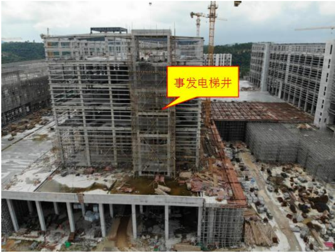
图二 事发坍塌电梯井脚手架位置（正面）